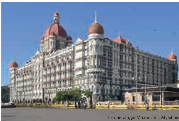
Отель «Тадж Махал» в г. Мумбаи

Tata Motor Ltd. Крупнейшая индийская автомобилестроительная компания, входящая в Tata Group. Штаб-квартира компании расположена в Мумбаи. В 2006 г. Международная организация автопроизводителей OICA занесла компанию в список 20 крупнейших автопроизводителей мира. В 2013/2014 г. ее консолидированный доход составил 38,9 млрд долл. Tata Motors является пятым по величине в мире производителем грузовиков и четвертым – автобусов. В группе компаний Tata Motors по всему миру занято более 60 тыс. человек. В сентябре 2004 г. Tata Motors прошла листинг на Нью-Йоркской фондовой бирже.