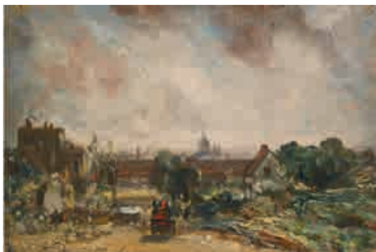
Джон Констебль. «Вид на Лондон с коттеджа сэра Стила, Хэмпстед»

Лучшие продажи летних аукционов Christie's и Sotheby's