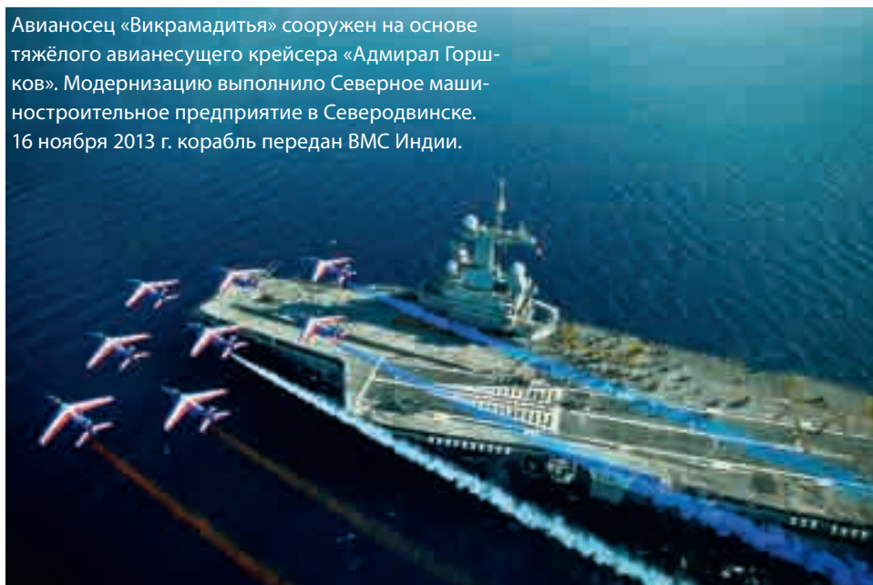
Авианосец «Викрамадитья» сооружен на основе тяжёлого авианесущего крейсера «Адмирал Горшков». Модернизацию выполнило Северное машиностроительное предприятие в Северодвинске. 16 ноября 2013 г. корабль передан ВМС Индии.

На данный момент Индия является вторым по величине рынком сбыта для российской оборонной промышленности.