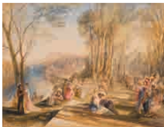
Уильям Тёрнер. «Дворец красавицы Габриель»

Этот набросок маслом на бумаге сделан в Хэмпстеде, где художник любил отдыхать летом, снимая коттедж для себя и слабой здоровьем жены. По соседству с ними жил известный английский политик, журналист и писатель сэр Ричард Стил, с которым дружил художник. На холме Хэверсток, где стоял коттедж сэра Стила, и сделан этот набросок.