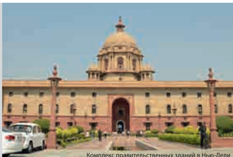
Комплекс правительственных зданий в Нью-Дели

«Лишь истина побеждает» – таков девиз Республики Индия, государства в Южной Азии, раскинувшегося на территории в 3,3 млн кв. км (7-е место в мире). Население Индии – более 1,2 млрд человек, это вторая по численности населения страна мира после Китая. Столица – Нью-Дели. Государственными языками являются хинди и английский, а официальными – эти два и еще 21 язык, на которых говорят в разных частях страны. Более 80% населения исповедуют индуизм. Индия – это парламентская республика с федеративным устройством. В состав Индии входят 29 штатов. В июле 2012 г. пост президента занял Пранаб Кумар Мукерджи. Премьер-министр – Нарендра Моди.