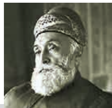
Джамшеджи Насарванджи Тата (1839–1904) – индийский промышленник и бизнесмен, один из отцов индустриализации Индии. Джамшеджи Тата является основателем крупнейшей индийской корпорации Tata Group.

Жизнь Тата пришлось на годы, когда Индия находилась под властью британской короны, англичане были сильны и жестоко подавляли любое попятное движение на несогласие с их политикой. Джамшеджи не было и 20 лет, когда он стал свидетелем жестокого подавления восстания, вспыхнувшего в стране в 1857 г.