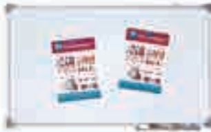
Информационные доски, промостолы, штендеры и многое другое!