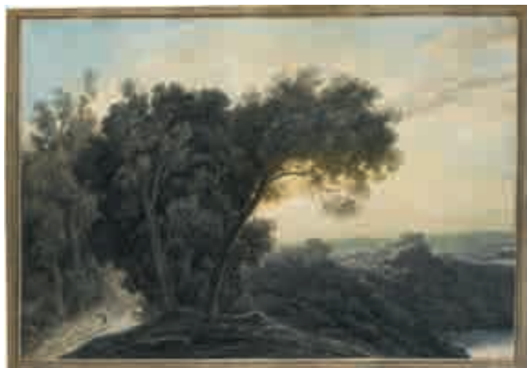
Джон Роберт Козенс. «Озеро Альбано и Кагель Гандольфо»

Небольшая акварель стилизована художником под старую работу. Центральной темой картины является вид на дворец Габриель д'Эстре, любовницы Генриха IV Наваррского, расположенный в 15 км от центра Парижа. Красивая и остроумная Габриель оказывала большое влияние на короля. Не без влияния своей фаворитки Генрих принял католичество.