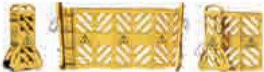
Переносные раздвижные ограждения «Желтая гармошка»

Компактные, устойчивые, раздвижные ограждения из прочного пластика с ребрами и отверстиями из алюминия в рабочем положении в сложенном состоянии — грузоподъем.